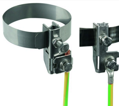
Az ábrák nem kötelező érvényűek